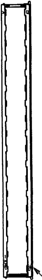
極数表示 POS. MANIFESTATION